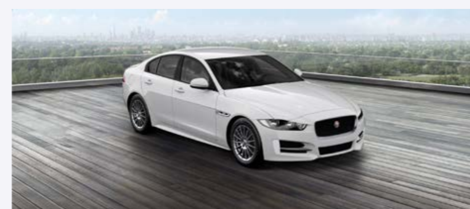
XE E-Performance ARNOLD KONTZ 100 YEARS R-SPORT Prix net: 36 950 €

Équipement de base R-Sport / Détecteur de pluie • Phares à allumage automatique • Navigation InControl TouCh SD • Jaguar Voice • PDC avant et arrière • Caméra de recul • Sièges chauffants • Phares bi-xénon avec feux de jour à LED