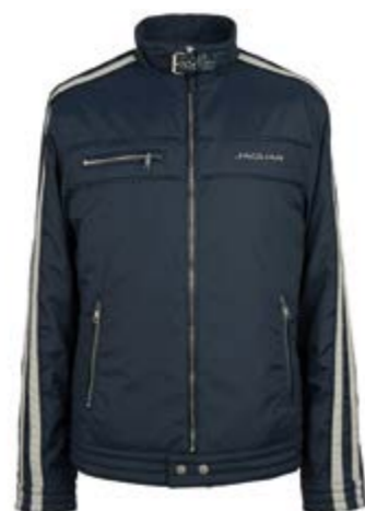
Men's drivers jacket = 112 €