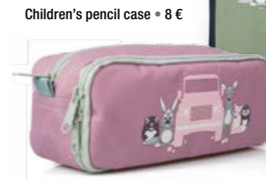
Children's pencil case = 8 €