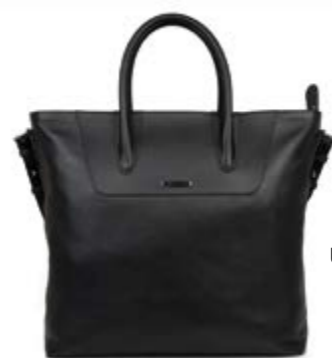
Ultimate leather tote bag = 348 €