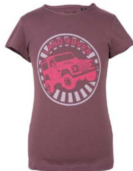
Girls' off-road Graphic t-shirt = 22 €