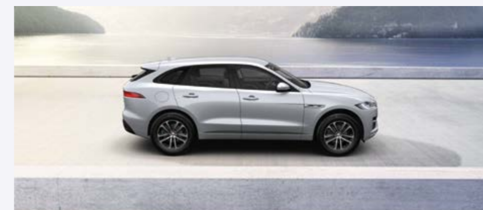
F-PACE ARNOLD KONTZ 100 YEARS R-SPORT Prix net: 57 950 €

Équipement de base R-Sport / PDC avant • Caméra de recul • InControl TouCh Pro navigation SSD • Écran couleur multi-tactile capacitif 10,2" • Combiné de bord numérique TFT 12,3" • Meridian™ 380 W avec 11 haut-parleurs • Pack InControl™ Connect Pro • Sièges sport en cuir perforé chauffants avant • tableau de bord revêtus en similicuir 'soft-touch' avec coutures contrastées • Double porte-gobelet avant avec couvercle • Toit fixe panoramique • Rétroviseur intérieur électro chrome • Rétroviseurs extérieurs rabattables électriquement avec éclairage de courtoisie