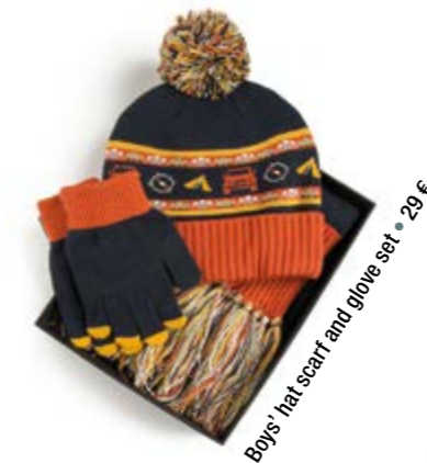
Boys' hat, scarf and gloves set = 29 €