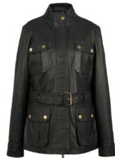
Women's Heritage Leather Jacket = 466 €

JAGUAR & LAND ROVER LUXEMBOURG - SERVICE APRÈS-VENTE