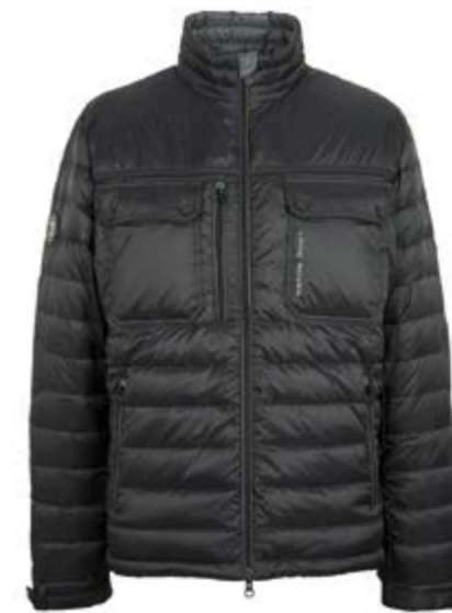
Men's Down Jacket = 207 €