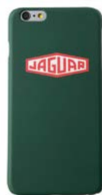
Heritage lozenge iPhone case = 18 €