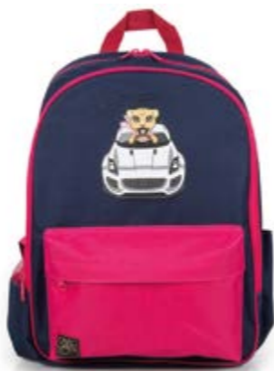
Children's rucksack = 24 €