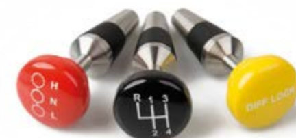
Heritage Darién Gap Bottle Stoppers = 53 €