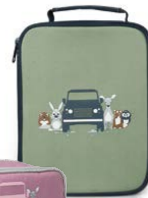
Children's lunch box = 12 €