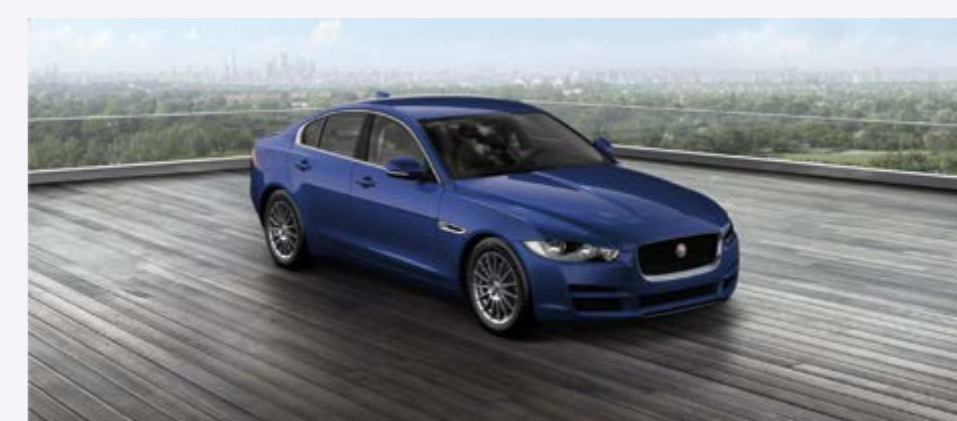
XE E-Performance ARNOLD KONTZ 100 YEARS PRESTIGE Prix net: 36 065 €

Équipement de base PRESTIGE / Essuie-glaces asservis à un détecteur de pluie • Phares à allumage automatique • Navigation InControl TouCh SD • Jaguar Voice • PDC avant et arrière • Caméra de recul • Sièges chauffants • Phares bi-xénon avec feux de jour à LED