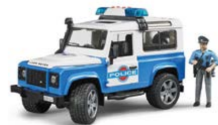
Defender police car = 47 €