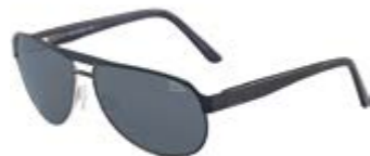
Men's aviator-style sunglasses = 124 €