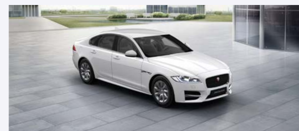
XF E-Performance ARNOLD KONTZ 100 YEARS R-SPORT Prix net: 42 370 €

Équipement de base R-Sport / Sièges chauffants avant • Navigation InControl TouCh SD • Jaguar Voice • PDC avant et arrière • Caméra de recul • Rétroviseur intérieur électro chrome • Sièges en cuir • Rétroviseurs extérieurs rabattables électriquement