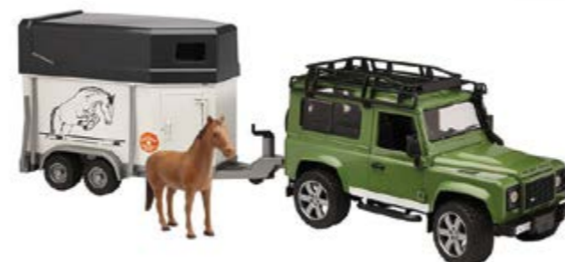
Defender horse box = 47 €