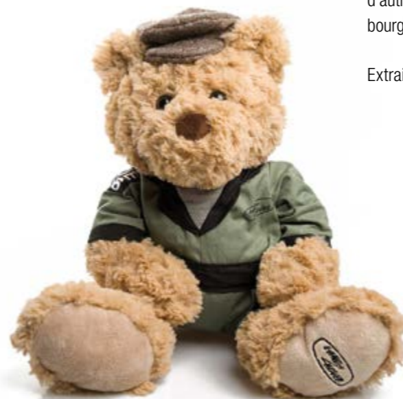
Hue Teddy Bear = 41 €