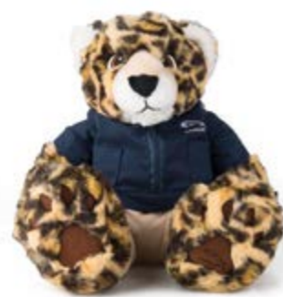
Teddy bear cub = 41 €