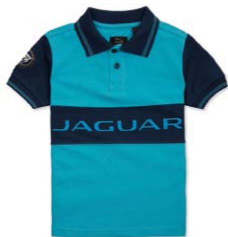
Boys' striped polo shirt = 30 €