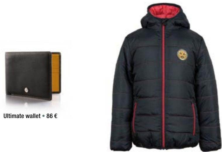
Ultimate wallet = 86 €