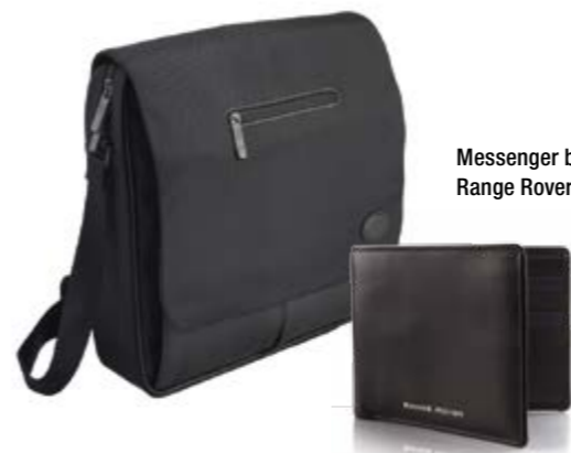
Messenger bag = 177 € Range Rover wallet = 83 €