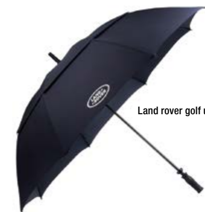
Land rover golf umbrella-manuel = 41 €