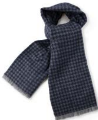
Houndstooth print scarf - navy = 29,5 €