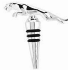
Leaper bottle stopper = 30 €

Dans cette nouvelle collection, vous trouverez la gamme de vêtements et d'accessoires dernier cri à la fois distingués et design. Tous ces articles Jaguar au caractère unique offrent un vaste choix qui saura véritablement satisfaire tous les amateurs de la marque.