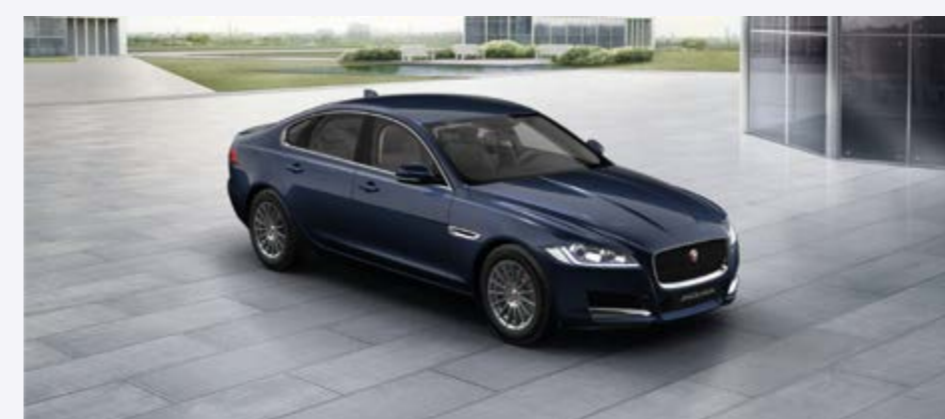
XF E-Performance ARNOLD KONTZ 100 YEARS PRESTIGE Prix net: 39 935 €

Équipement de base PRESTIGE / Sièges chauffants avant • Navigation InControl TouCh SD • Jaguar Voice • PDC avant et arrière • Caméra de recul • Rétroviseur intérieur électro chrome • Soutien lombaire • Rétroviseurs extérieurs rabattables électriquement