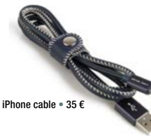
Leather wrapped iPhone cable = 35 €