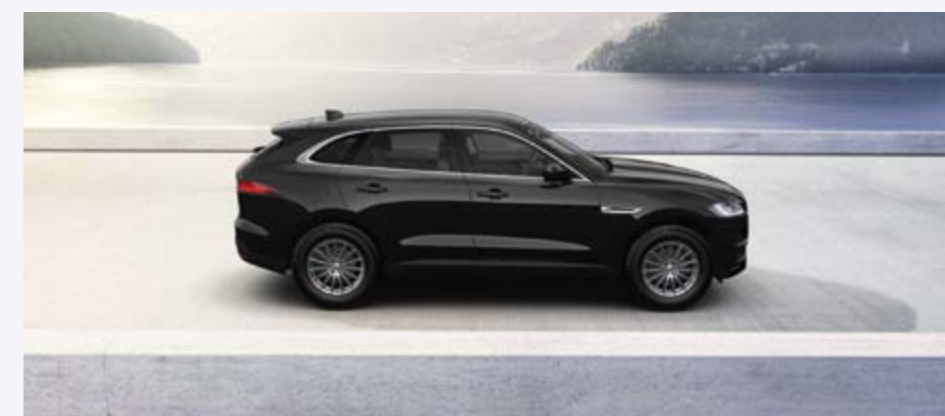
F-PACE ARNOLD KONTZ 100 YEARS PRESTIGE Prix net: 54 100 €

Équipement de base PRESTIGE / PDC avant • Caméra de recul • InControl TouCh Pro navigation SSD • Écran couleur multi-tactile capacitif 10,2" • Combiné de bord numérique TFT 12,3" • Meridian™ 380 W avec 11 haut-parleurs • Pack InControl™ Connect Pro • Sièges chauffants avant à réglage électrique et soutien lombaire • Double porte-gobelet avant avec couvercle • Toit fixe panoramique • Rétroviseur intérieur électro chrome • Rétroviseurs extérieurs rabattables électriquement avec éclairage de courtoisie