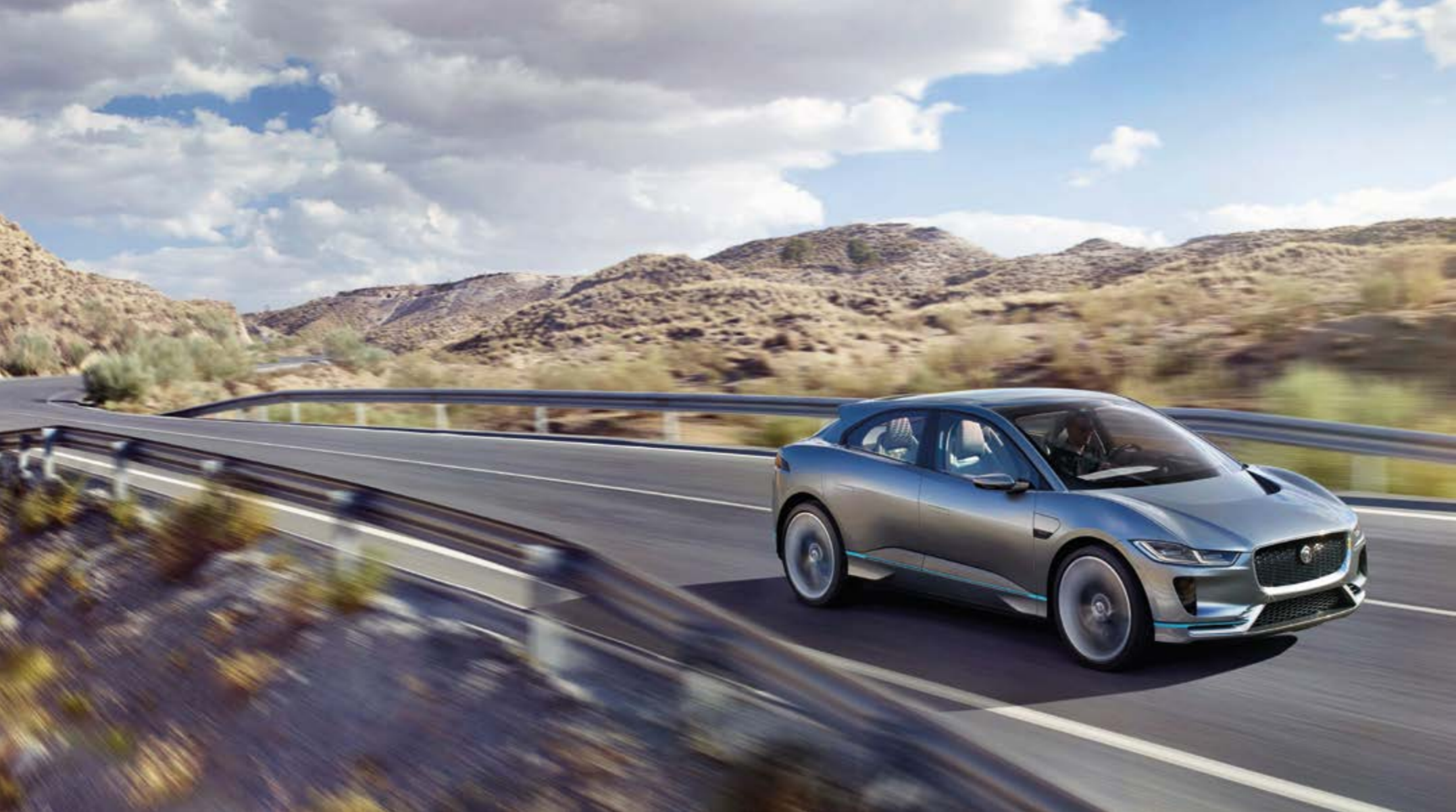
JAGUAR I-PACE CONCEPT