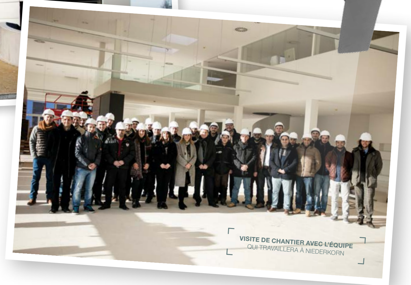
VISITE DE CHANTIER AVEC L'ÉQUIPE QUI TRAVAILLERA À NIEDERKORN