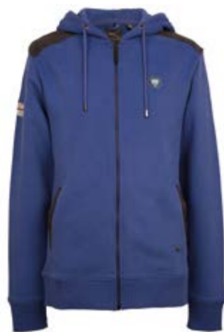
Men's growler graphic full zip hoodie = 65 €