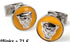
Ultimate cufflinks = 71 €